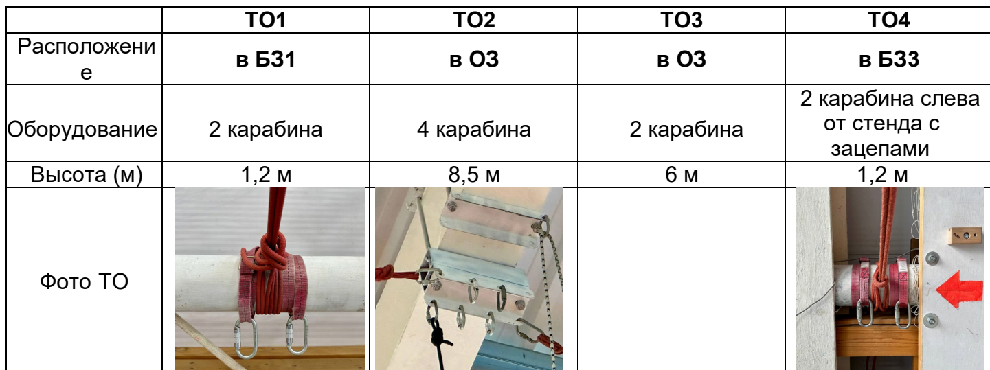
Схема дистанции. Расположение ТО, ВСС и БЗ