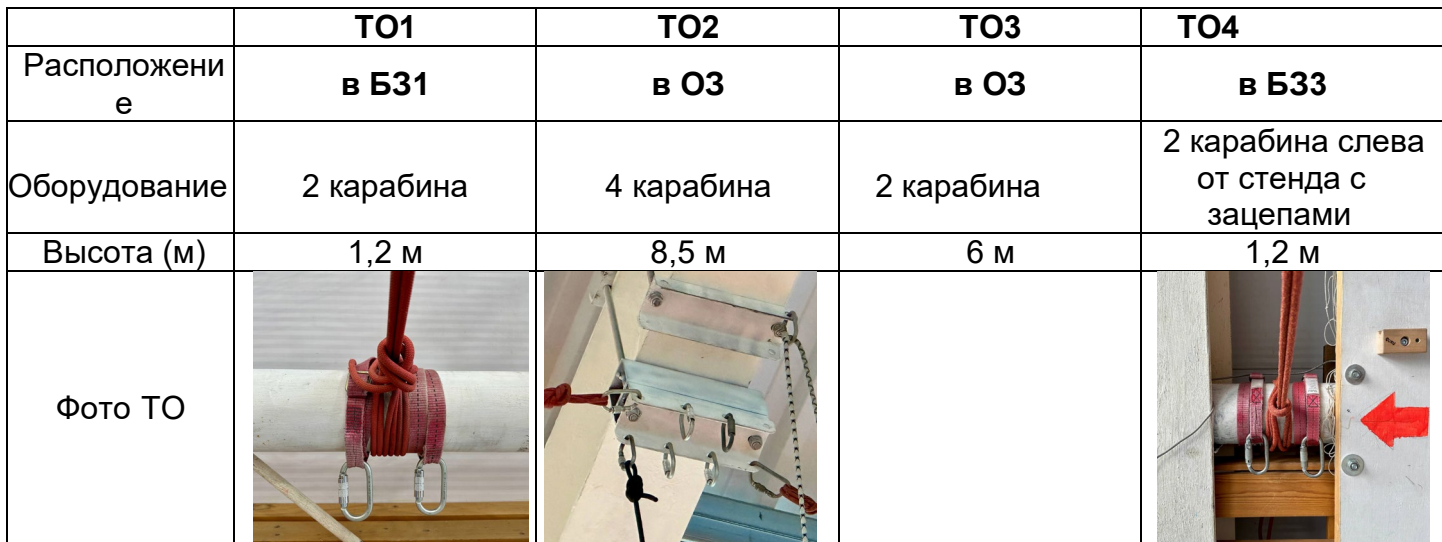
Схема дистанции. Расположение ТО, ВСС и БЗ