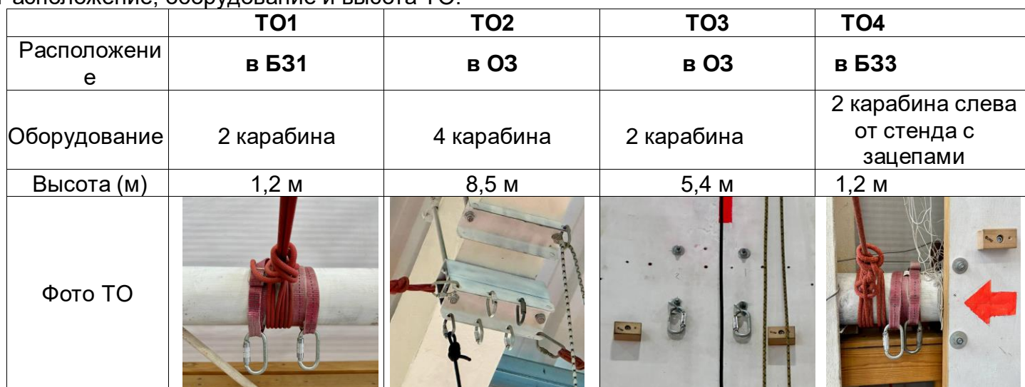
Схема дистанции. Расположение ТО, ВСС и Б3