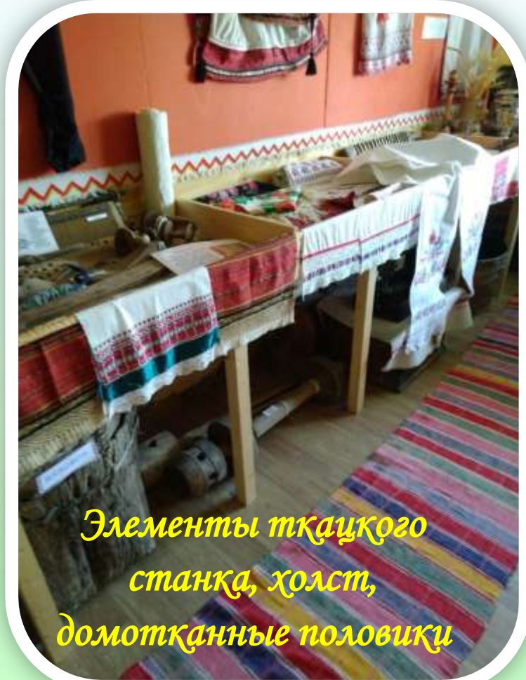
Элементы ткацкого станка, холст, домотканные половики