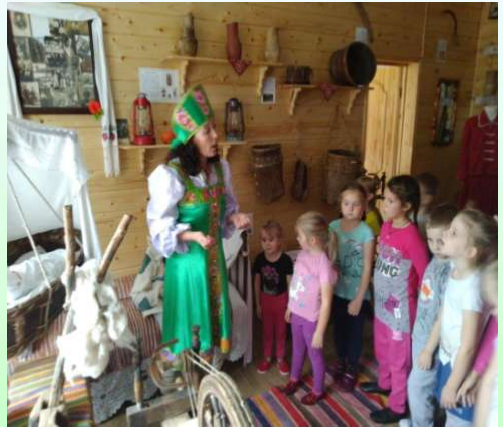
Гости музея - дошкольники