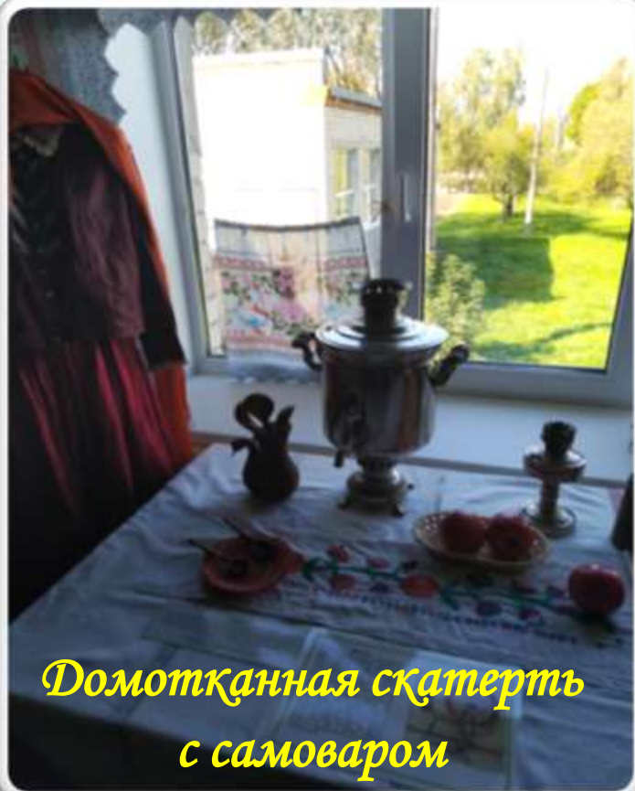
Домотканная скатерть с самоваром