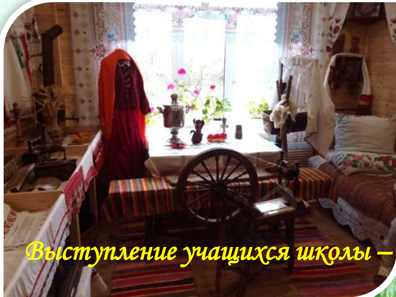
Выступление учащихся школы – «Живи, моя, деревня»