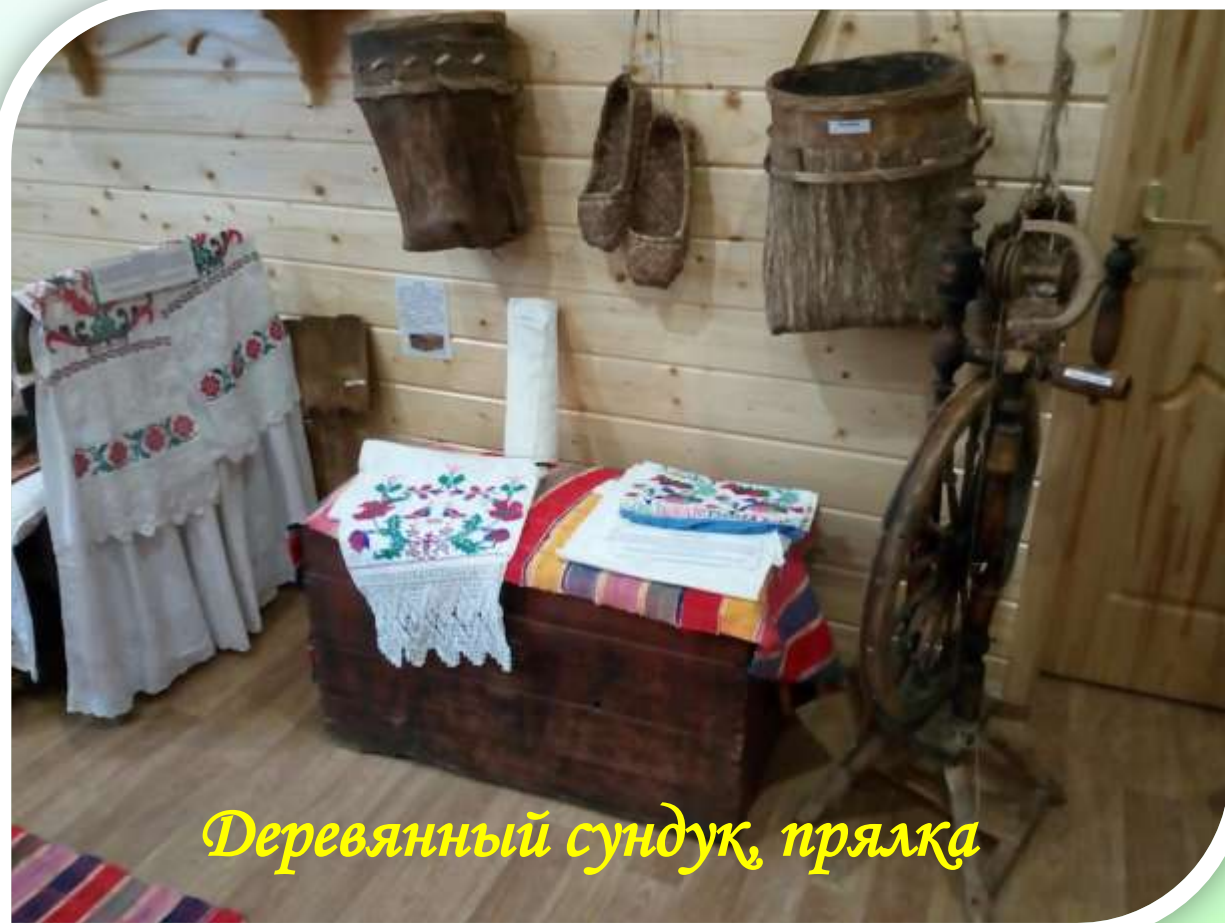
Деревянный сундук, прялка