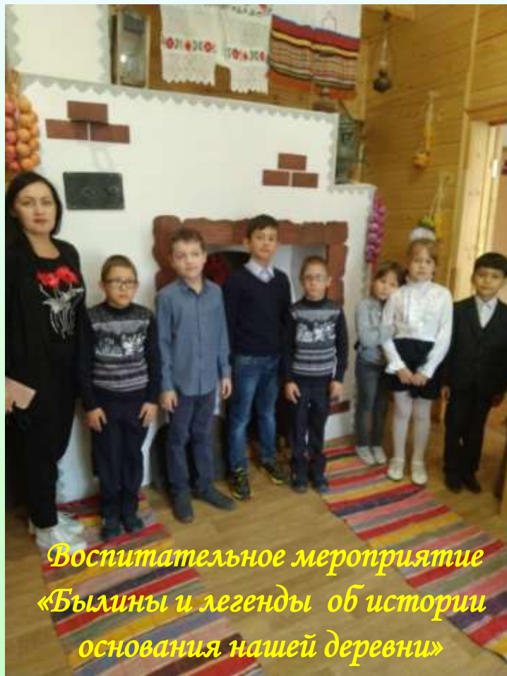
Воспитательное мероприятие «Былины и легенды об истории основания нашей деревни»