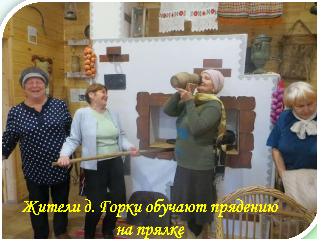
Жители д. Горқи обучают прядению на прялке