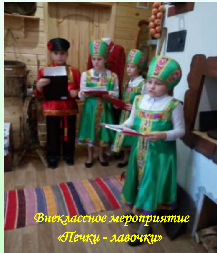
Внеклассное мероприятие «Печки - лавочки»