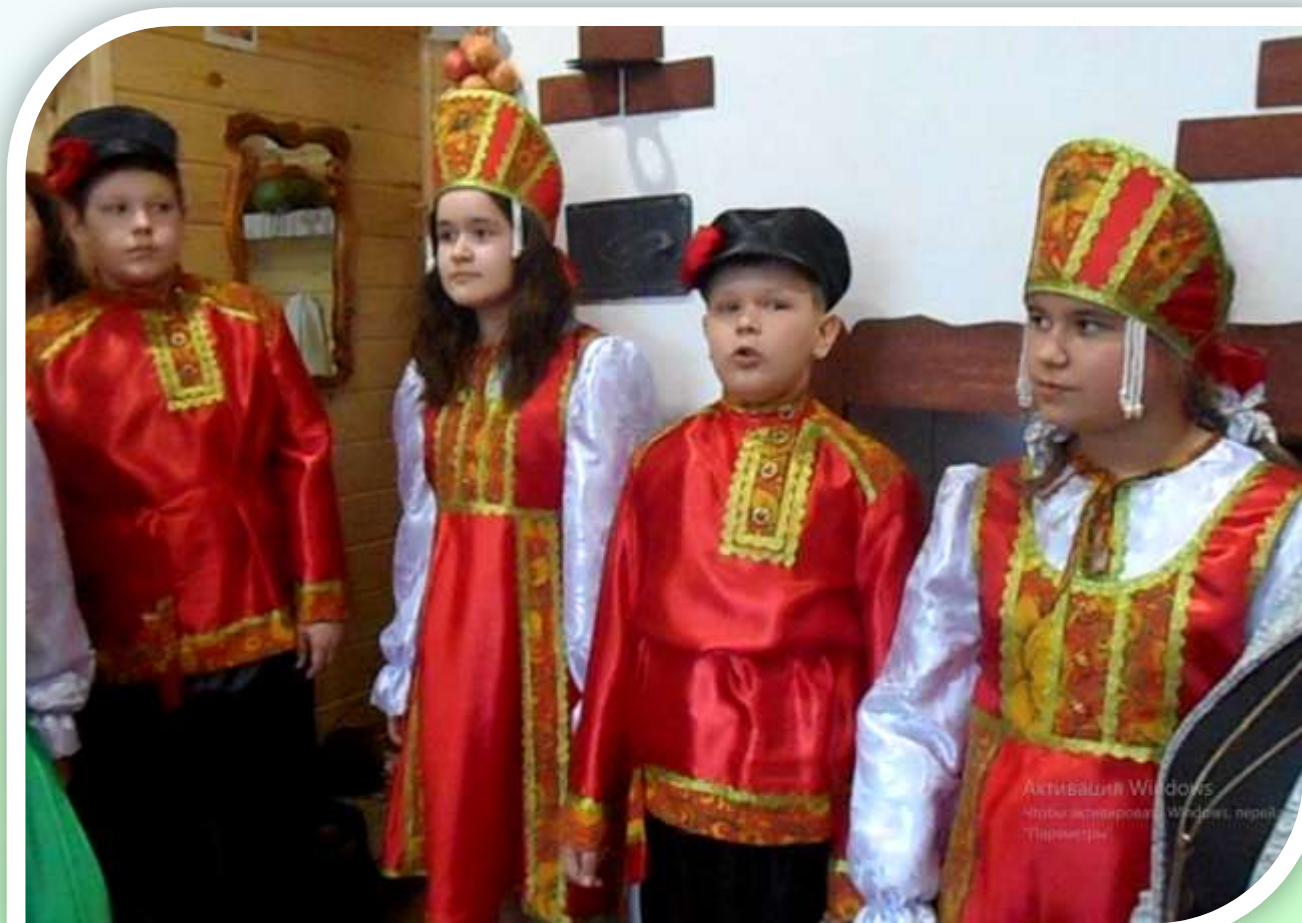
Фольклорные миниатюры в музее