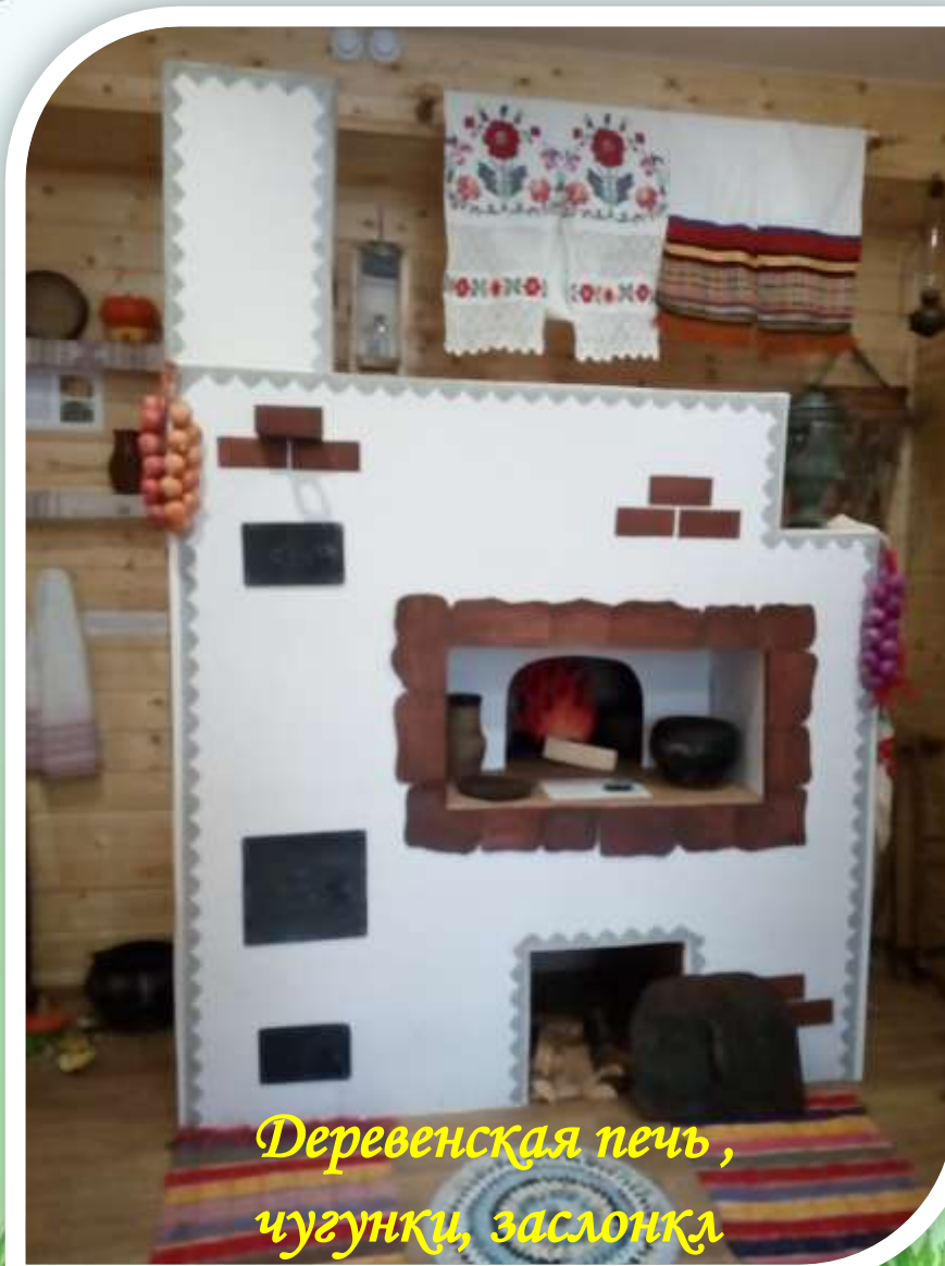
Деревенская печь, чугунки, заслонка