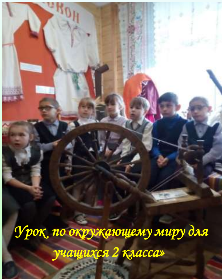
Урок по окружающему миру для учащихся 2 класса»