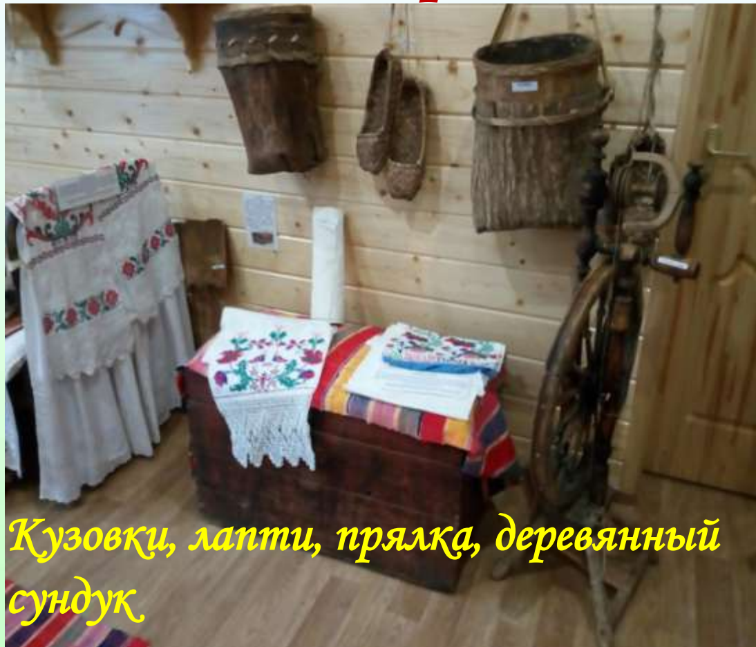
Кузовки, лапти, прялка, деревянный сундук