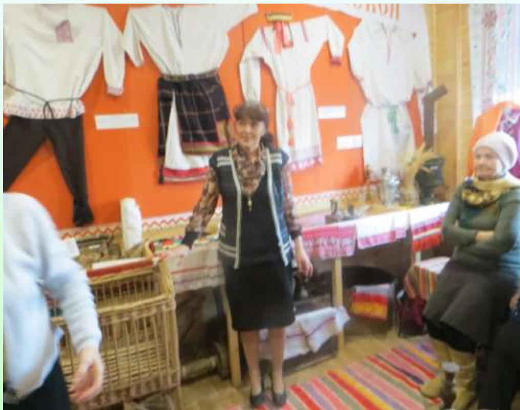
Жители д. Горки на празднике «Деревенские колядки»