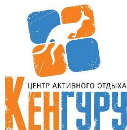
Центр активного отдыха «Кенгуру»